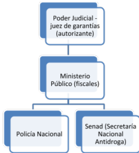
Fig. 2: Procedimiento para interceptar comunicaciones