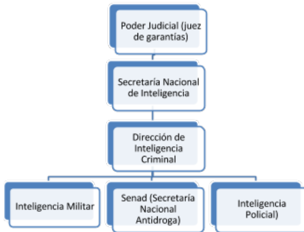
Fig. 4: Procedimientos de los cuerpos de inteligencia para vigilancia de las comunicaciones